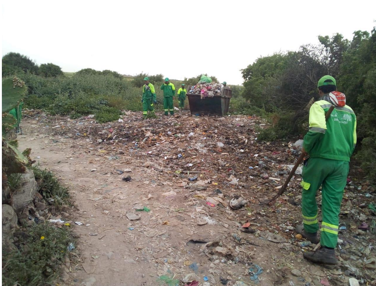
Figure 6 : Nettoyage des alentours des caissons et dépôts sauvages