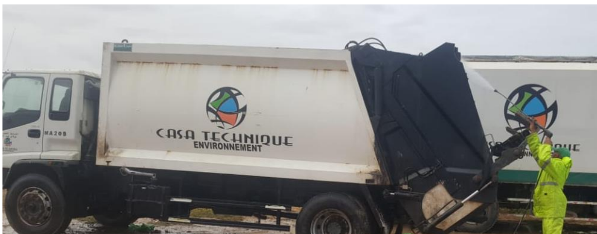
Figure 8 : Opérations de lavage des véhicules