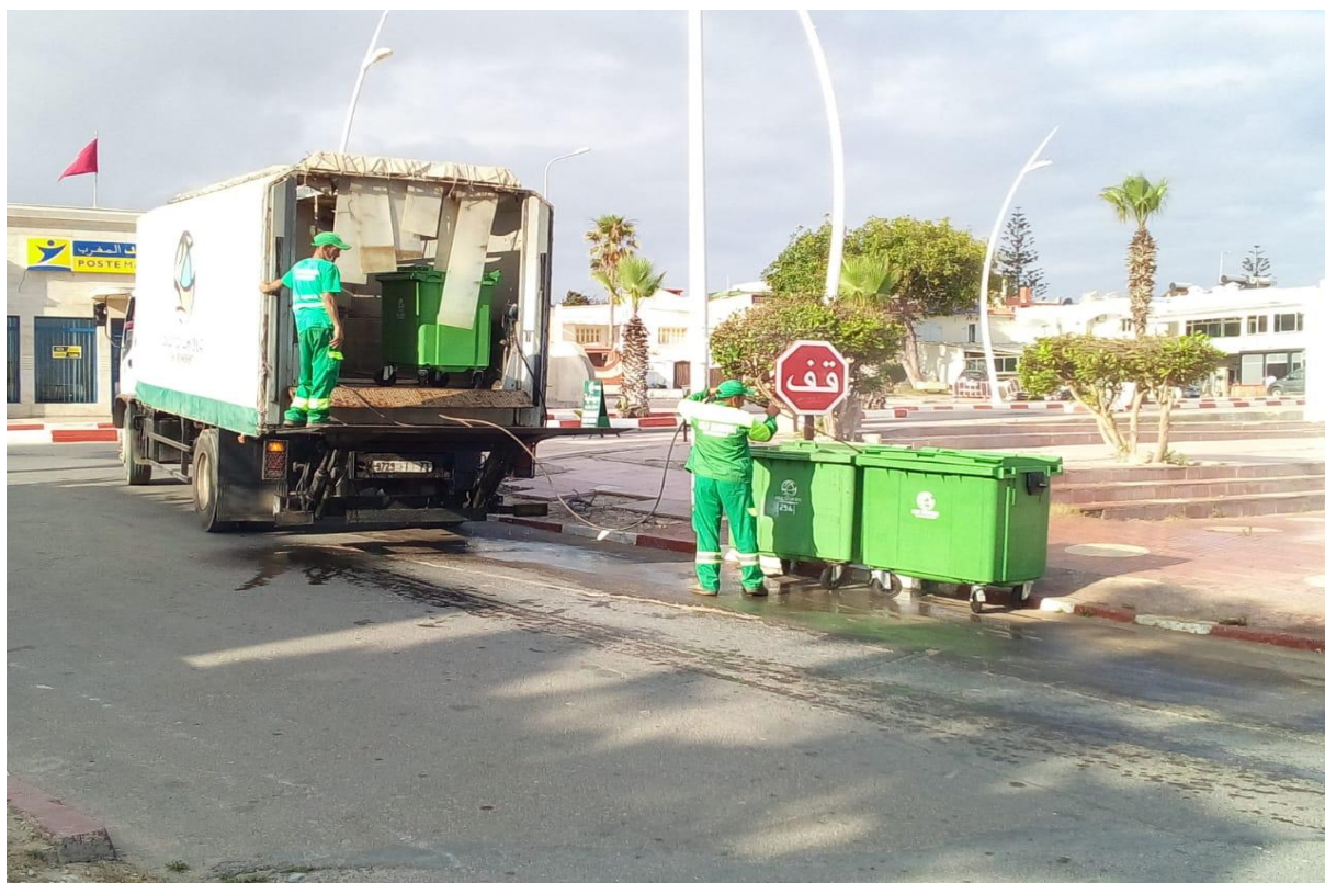
Figure 9 : Lavage des bacs

Le lavage des bacs se fait d'une façon systématique selon les saisons