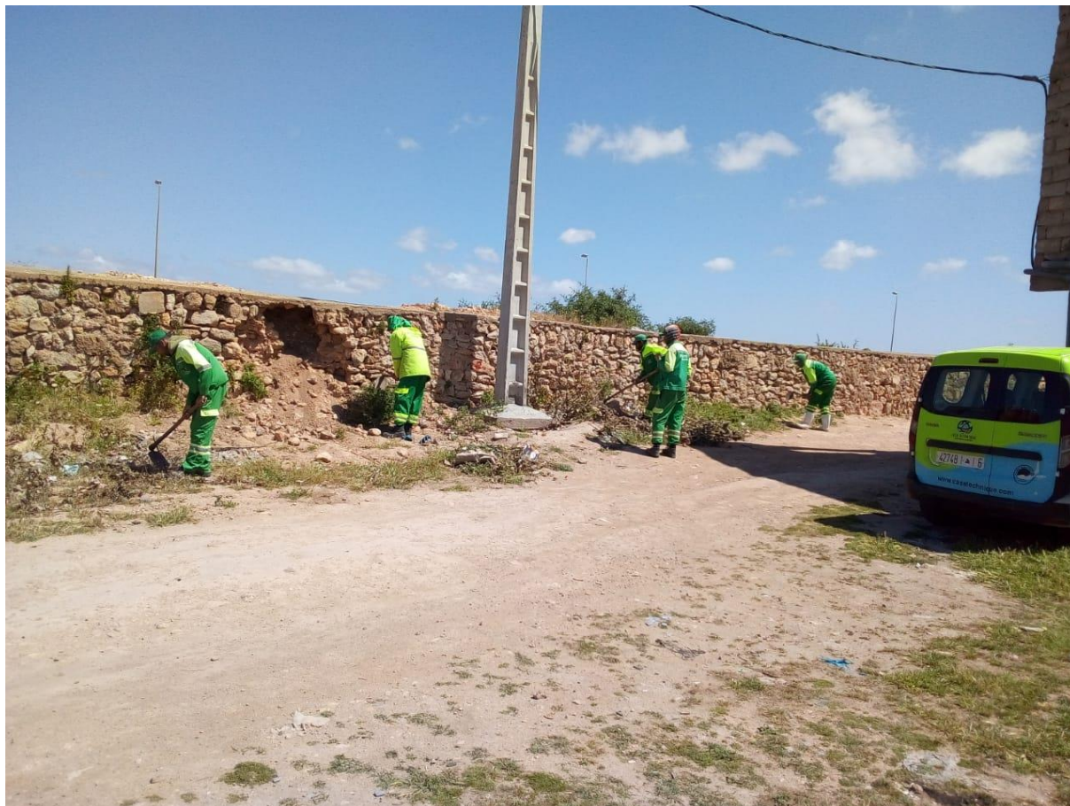
Figure 4 : Opérations de désherbage

Casa Technique fournit de grands efforts concernant le désherbage, la société a procédé à l'opération dans plusieurs zones de Sidi Bouzid. Les figures suivantes représentent l'activité de désherbage réalisée par nos agents: