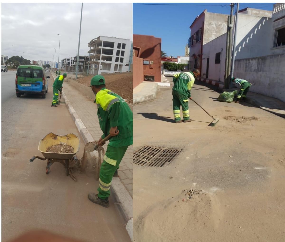
Figure 2: Opérations de balayage

Casa Technique a intervenu chaque fois qu'une demande est faite. Les illustrations suivantes représentent l'intervention de Casa Technique pour le nettoyage dans différentes zones à Moulay Abdellah :