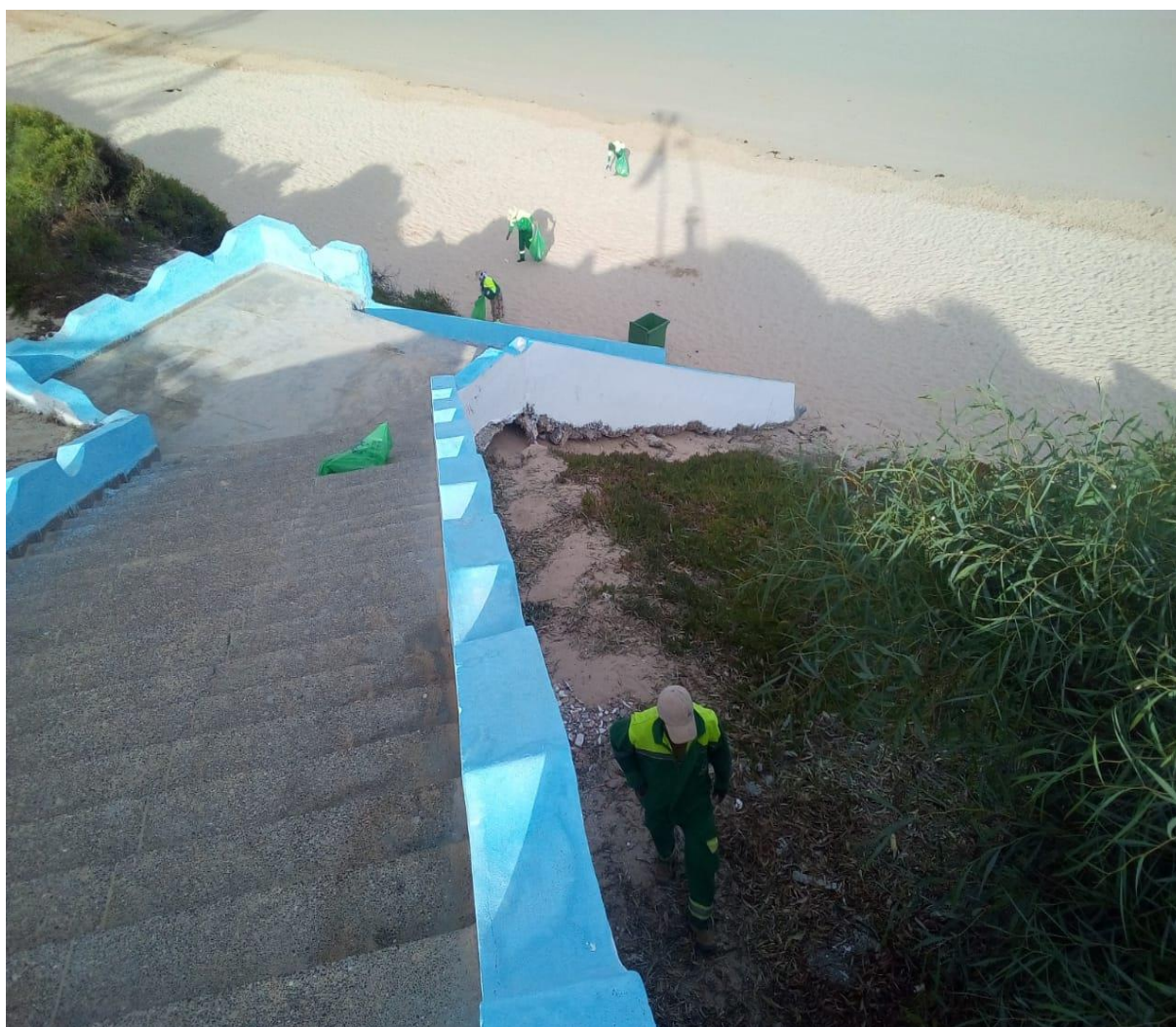
Figure 3 : Nettoyage manuel de la plage