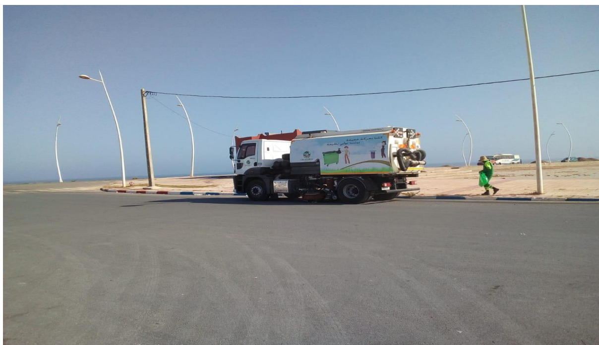
Figure 7: Opérations de balayage mécanique