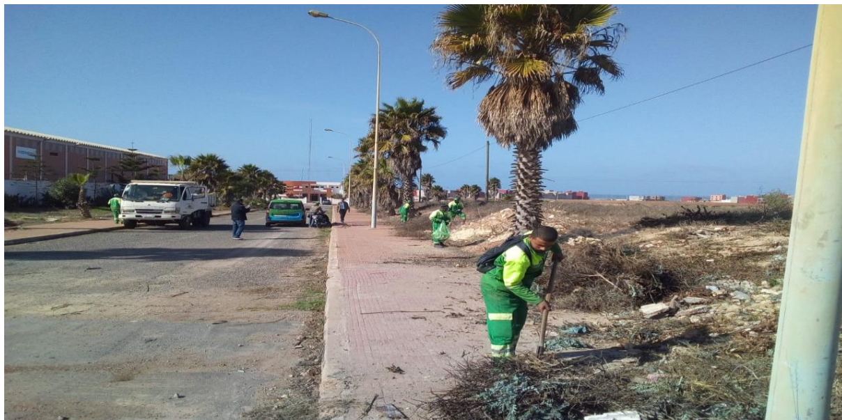
Figure 10 : Eradication des déchets verts